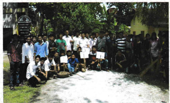
Swachh abhiyan by NSS Unit on 13th September, 2015.

for the welfare of the society through NSS camp from time to time. It organized NSS camp at Dongibil HS School on 26.09.2015 and another camp was organized at Kholaguri on 16.10.2015.