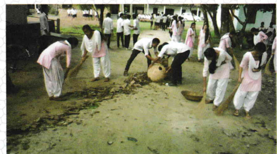
Programme of NSS Unit and swachh abhiyan on 17-19 January, 2016.